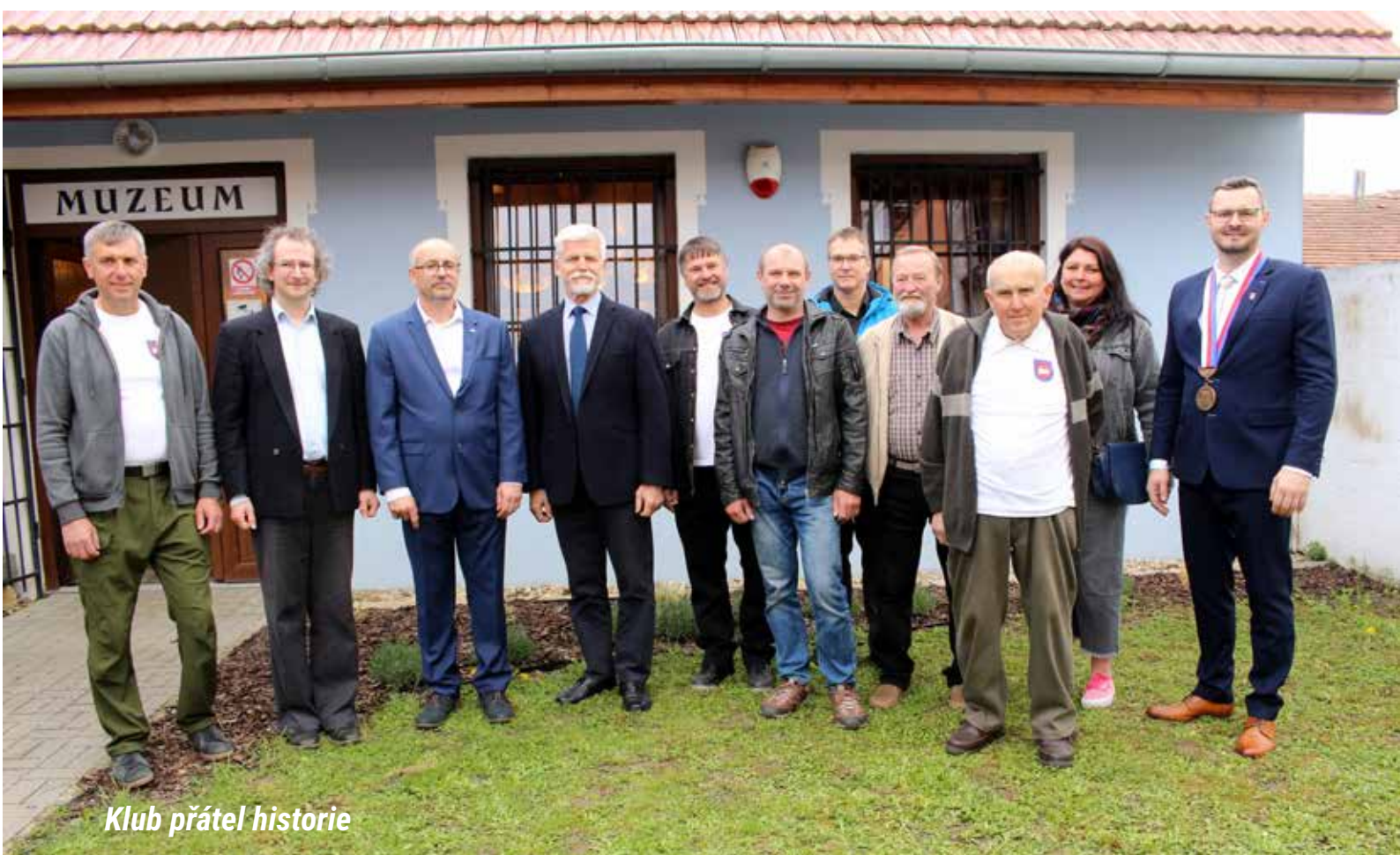
Klub přátel historie