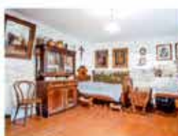
Lidový domek Hájceček