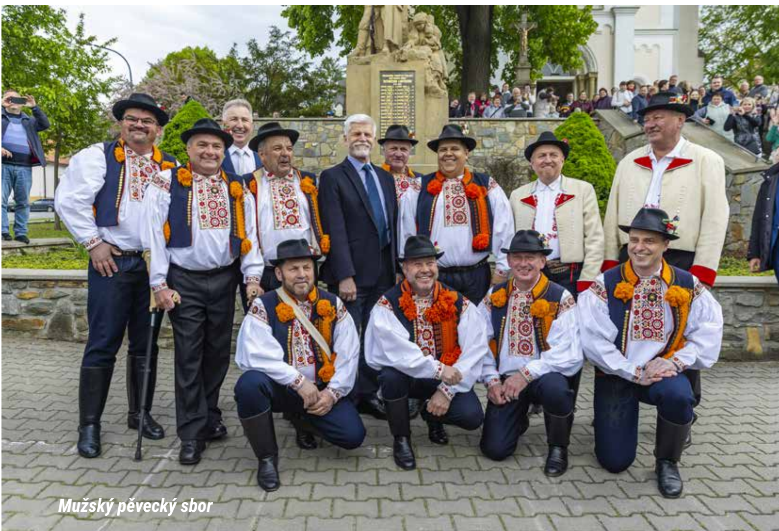
Mužský pěvecký sbor