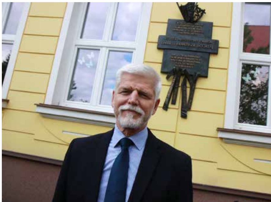
Prezident Petr Pavel pod plastikou generála Bogataje.