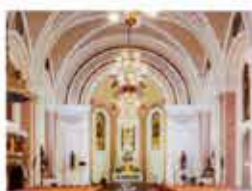
Kostel sv. Jakuba Staršího