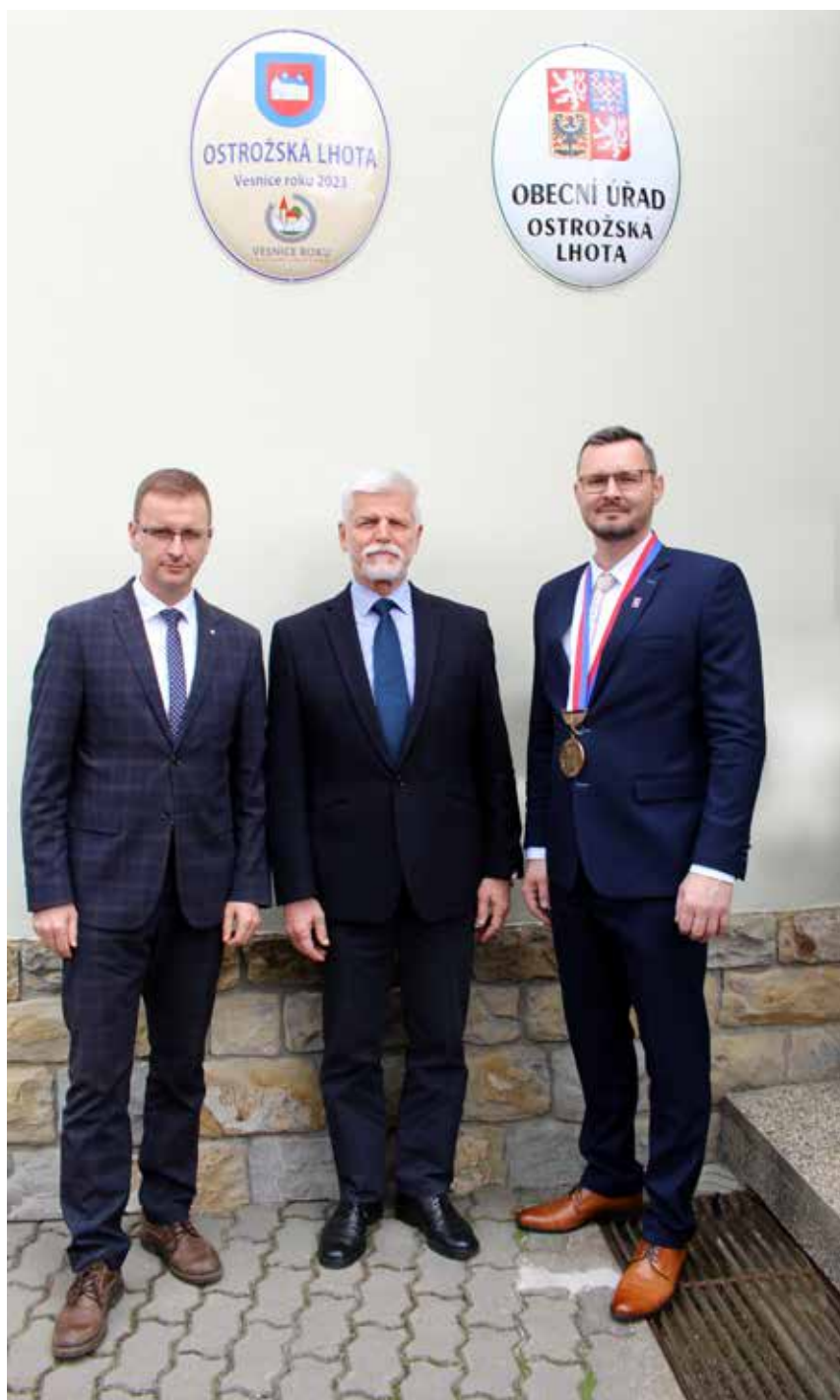
Pánové hejtman, prezident a starosta u obecního úřadu

Sepsal jsem požadované čili upřesnění a představy průběhu návštěvy pana prezidenta (přivítání před OÚ za doprovodu cimbálové muziky Višňa, pozdravení občanů Ostrožské Lhoty před OÚ panem prezidentem. V sále obecního domu drobné občerstvení, stručné představení obce, podpis pana preziden-